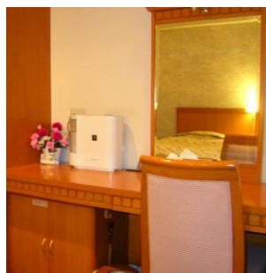
ホテル客室使用例